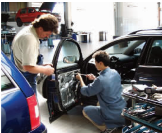
德国教师指导金陵中专汽修专业学生