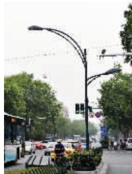
板仓街出新后,部分路灯搬到绿岛上