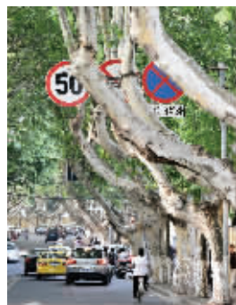
一些路段的行道树挡住了路灯和信号灯