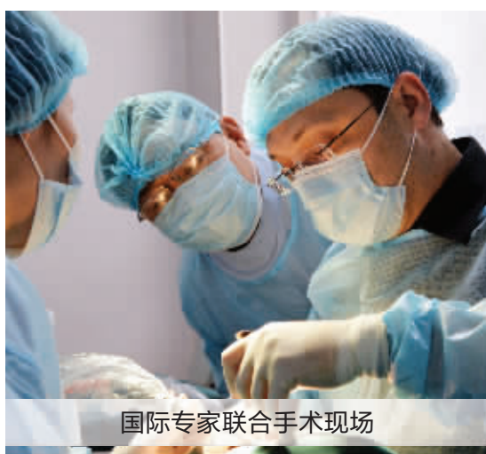
国际专家联合手术现场