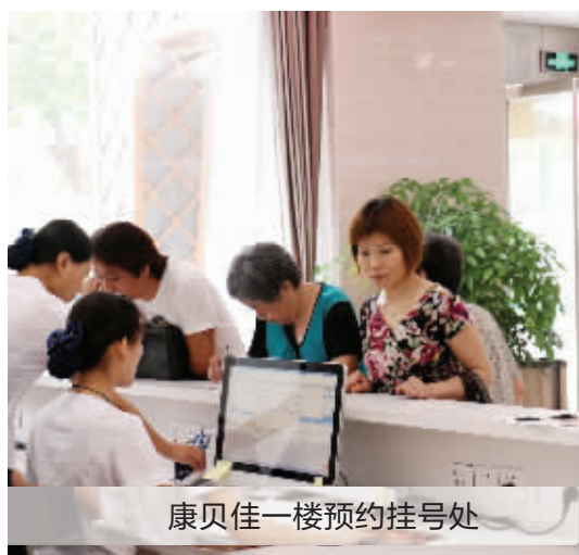
康贝佳一楼预约挂号处

据悉,期间,凡电话预约来诊的患者,仍可享受专项爱牙基金补贴:种植牙每颗最高补贴6000元,全瓷美牙冠每颗最高补贴2000元,牙齿矫正最高补贴8000元。此外,所有来院人员再享五项免费:免专家亲诊费、免全口检查费、免口腔内窥镜费、免牙周疾病测定费、免种植方案设计费。机会难得,如果您有缺牙、牙齿松动、活动假牙不牢、烤瓷牙失败等情况,赶紧拨打电话预约专家,与国际种植牙专家零距离接触,一对一亲诊。