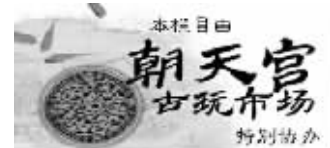
本稿件由朝天宫古玩市场提供