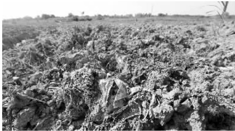
生活垃圾被填到地里