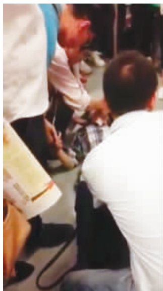
女孩晕倒后,周围乘客纷纷出手相助

昨天早上8点半左右,正是上班高峰,2号线一列从油坊桥开往经天路的车,刚刚关上车厢门,从奥体东站出发,忽然车厢里靠门的位置,一位原本站着的年轻女孩儿一头栽倒在地,晕了过去,随身携带的物品、钱包、化妆品等,也散落了一地。