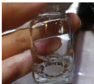
新街口一商铺卖的“美瞳”没有标签

装饰性彩色平光隐形眼镜俗称“美瞳”。近日,青岛出入境检验检疫局执法人员多次发现“美瞳”进境邮包破损、护理液外溢等情况。据了解,彩色隐形眼镜经营者必须取得相关资质,进口产品必须有进口医疗器械批准文号。记者探访发现,新街口一些小商铺出售的美瞳产品,有的连标签都没有。 现代快报记者 张希为 吴怡