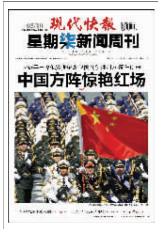
(上周星期柒新闻周刊封面)