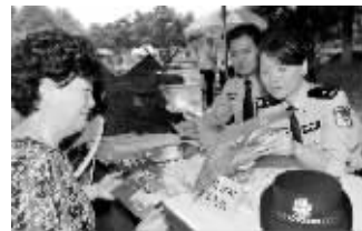
民警给市民讲解防骗知识

昨天上午，在南京图书馆前的市民广场，江苏省暨南京市公安局开展“5·15”打击防范经济犯罪广场宣传活动，咨询者以老年人为主，大多关注集资诈骗案件，在高额利息诱惑下，许多人把养老钱都拿出来“投资”。