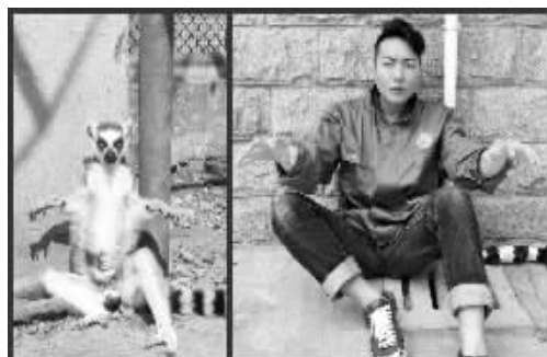
饲养员的“动物模仿秀”

快报讯(通讯员 陈圆圆 记者 吴怡)这两天,红山动物园的饲养员们掀起了一股“动物模仿秀”。因为每天和动物朝夕相处,他们的模仿都很逼真。现在,小朋友也有机会来当一天的临时饲养员,走近动物,了解动物的喜好习惯,快来参加红山动物园的夏令营吧!