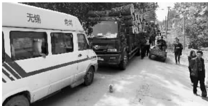
这些货车被一辆依维柯堵在路上

事发泗洪,司机称经谈判降到2000元,但还是拿不出来;乡政府称收费是村民自发组织的