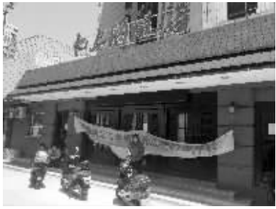
供货商在饭店门前讨说法