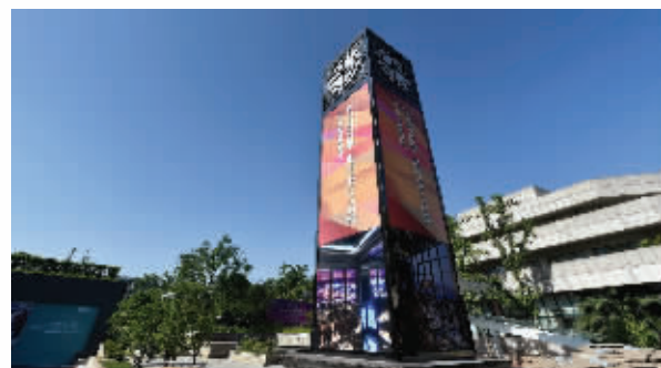
广场西侧竖起了一座大钟楼