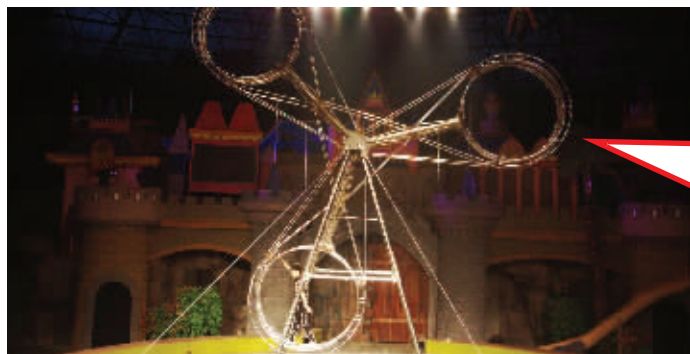
重组的“铁三角”表演队伍,正在试演