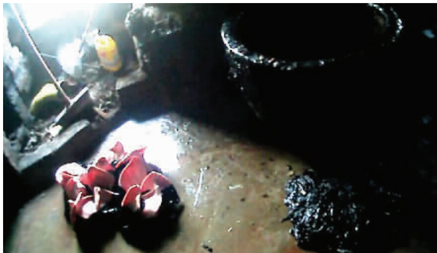
黑作坊现场

面沥青色的物体就是松香。老板交代,这是50斤的食用松香熬制而成,一般会使用1到2个月才会进行更换。随后作坊主被警方带回机场派出所进行进一步调查工作。