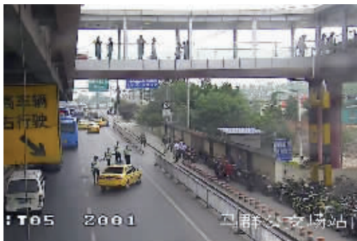
马群地铁站附近违停的拉客出租车

现代快报记者调查发现,位于城东的马群地铁站,因为人流量很大,许多出租车司机常常盘踞在地铁站附近等客,道路通行也因此时常受到影响。前天上午,记者来到了该地铁站口,发现就在马群地铁站的出口,已经有三辆出租车直接违停在路边,一看到有乘客出来,司机就会跑出来招呼,“去哪里,要不要打车啊。”其中一位的哥告诉记者,因为马群地铁站客流量比较大,就像迈皋桥地铁站一样,不少乘客出来,必须要再转公交或者打车回家,因此在地铁站旁边守候,比车子空跑来得更实惠一些。