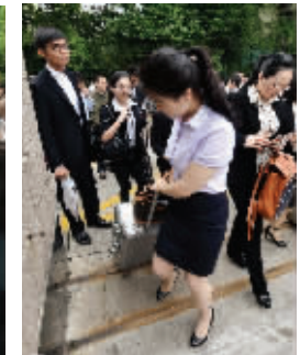
考生通过抽签决定入场顺序