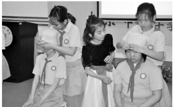
洪武北路小学的孩子在包扎

快报讯(通讯员 张倩雯 记者 黄艳)头部包扎、膝部带式包扎,昨天是世界红十字日,在南京市洪武北路小学(南京市红十字会小学)里,包扎社团的学生们向大家展示自己的包扎技能。在关键时刻,这些小朋友平时苦练的功夫可以救人。这所学校四至六年级的学生,能掌握四种包扎方法。