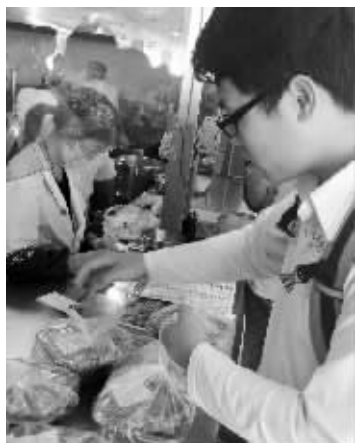
团队成员到食堂取餐