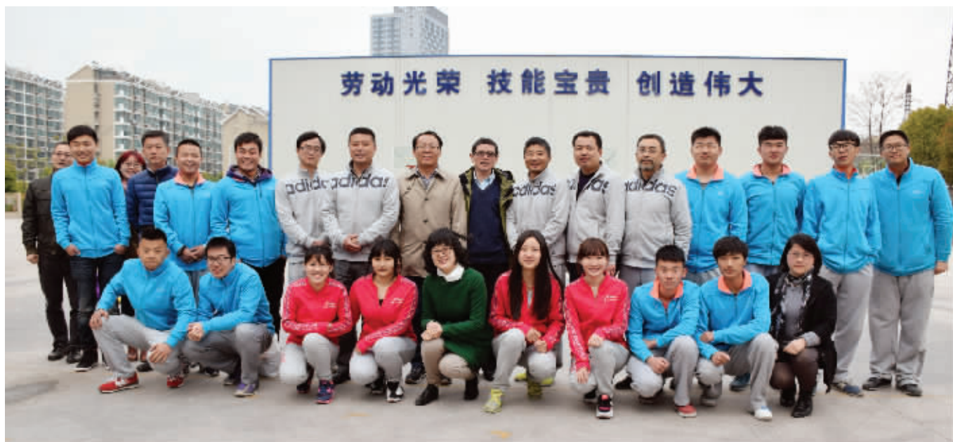
我们是一个奋进的集体

说起职业学校的技能大赛,普通中学的老师可能还比较陌生。在职业学校,有人人耳熟能详的两句话:“普通高中看高考,职业高中看大赛”“技能大赛引领职业学校发展”,由此可见技能大赛在职业学校的价值和地位。多少曾在中考中失利的学生通过技能比赛重新找回自信;多少获得省赛金牌的学生进入本科院校,圆了大学梦。而这背后,都离不开职校教师的努力。教师们投入了大量的精力和时间,无私奉献,付出了无数的艰辛汗水。