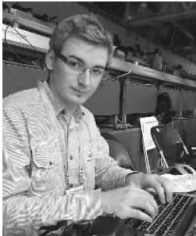
克里斯托夫神似哈利·波特