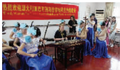
学生与澳大利亚客人联欢

“让感悟成为课堂教学的基础、让探究成为课堂教学的常态、让点拨成为课堂教学的亮点”已成为学校追求的一种教学模式。在实施电子备课的同时,英语组的“教