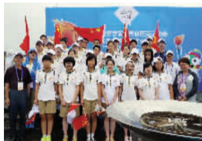
学生参加青奥火炬接力