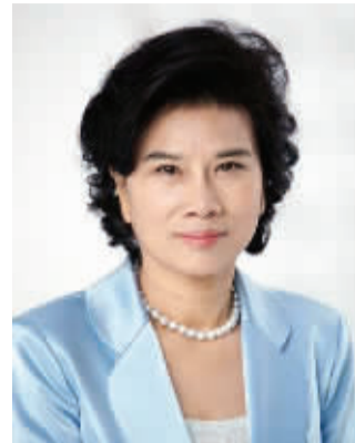
格力电器董事长兼总裁董明珠

4月27日，格力电器公布2014年年报，公司净利较上年同期增长30.22%，拟每10