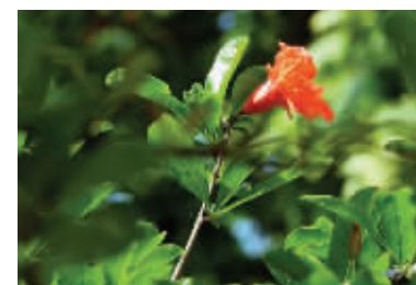
石榴花红艳艳

快报讯(记者 余乐)夫子庙大观园前有株116岁的古石榴树。昨天,现代快报记者发现,老树抽出嫩绿新枝,开出红褐色、重瓣的花。园林部门的工作人员告诉记者,这株老树很“坚强”,之前曾在大雨中倒伏,而且还紧挨核心区景区的公厕,但它的长势倒是越来越茁壮了。