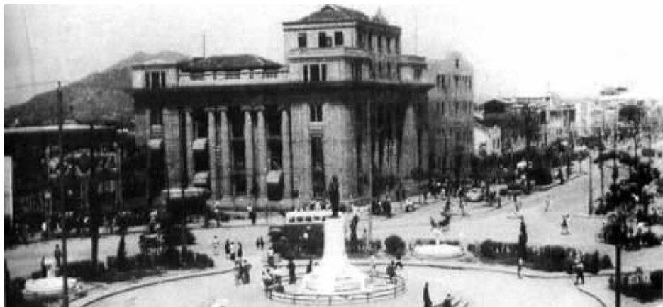
民国时期的交通银行南京分行大楼