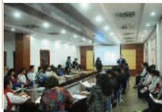
中美班学生出国咨询会