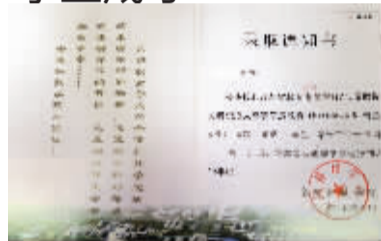
金陵科技学院录取通知书

中高大专班: 学生进入中高大专班学习,经过1年时间学习普高课程,次年10月份参加考试,通过考试的学生,先在第三年前修完剩下的中专课程,然后升入江苏青年干部管理学院读大专。完成学业的学生可以