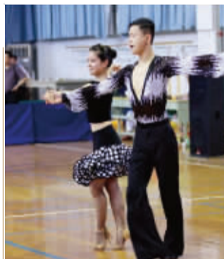
旅游系体育舞蹈专业学生在训练