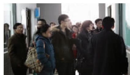
校企合作企业领导参观学校实训大楼