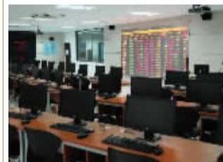
财商系证券交易模拟实训室