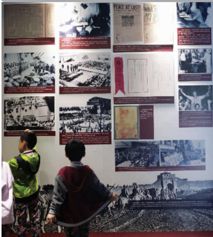
近300张珍贵图片亮相展览