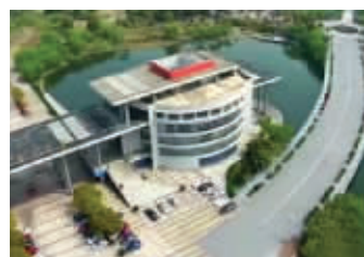
《邮迹》视频截图

早在去年,南邮摄影协会的小伙伴们就拍摄过一部名为《淘美南邮》的纪录片,这次的《邮迹》则是该系列的第二部,“第一部推出后,收到了同学们的大量好评,这给了