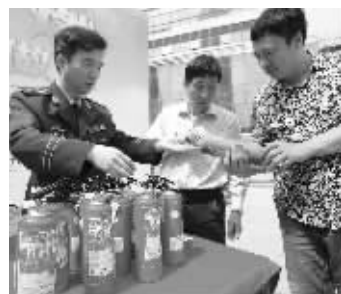
消防员向车主宣传灭火器使用知识