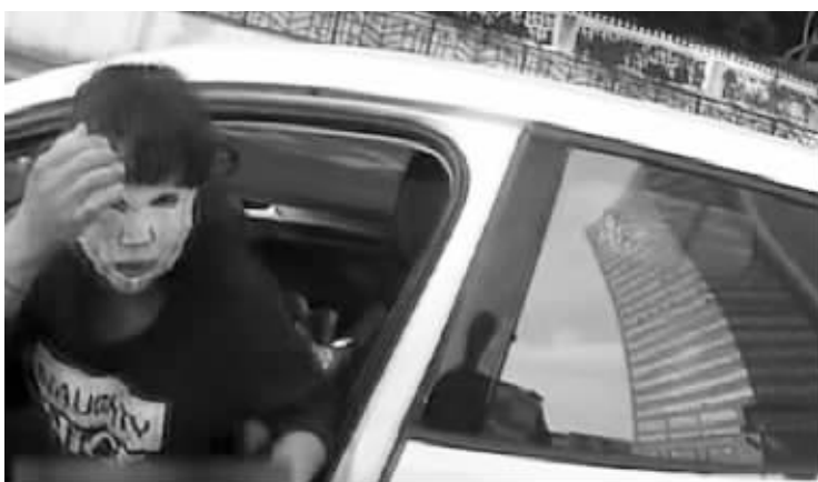
贴着面膜开车的女司机

快报讯(通讯员 陈曦 实习生 苏杰 记者 王瑞)因为赶着接孩子放学,女司机从美容院出来,还敷着面膜就开起了车。结果由于面膜影响视线,闯了红灯,被交警拦下才意识到自己违规。