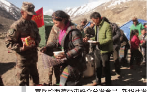
官兵给西藏受灾群众分发食品