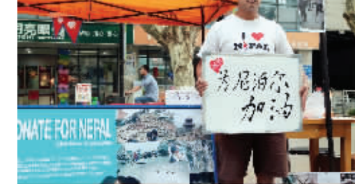
尼泊尔留学生自发捐款

快报讯(实习生 付晓晓 记者 陈志佳)尼泊尔发生的大地震，牵动着尼泊尔在中国求学的学子的心。这两天，南京航空航天大学尼泊尔留学生们自发组织了起来，互帮互助。昨天，现代快报记者来到南航校园，了解到在此次地震中，绝大部分尼泊尔留学生的家都受到了不同程度的损毁，其中一名大四年级同学的父亲，还在地震中不幸丧生，这位学生已启程回国。留在南京的留学生们想到用募捐的方式支援祖国。记者在募捐活动的现场看到，挂着“尼泊尔加油”等鼓励和祈福的标语，组织者还特意穿起了印有“我爱尼泊尔”字样的T恤，仅半天时间就募集到几千元爱心款。