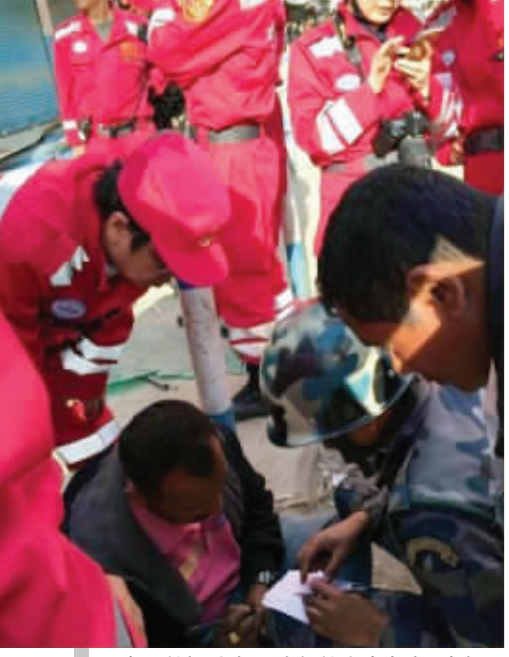
中国救援队在尼泊尔救出幸存者