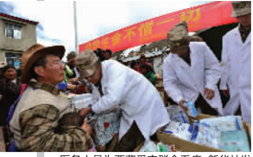
医务人员为西藏受灾群众看病

尼泊尔内政部一名官员27日对媒体表示，25日强震已在尼泊尔境内造成3726人遇难。受尼泊尔强烈地震影响，西藏聂拉木、吉隆、定日、萨嘎、仲巴、亚东、拉孜、普兰等县受灾严重。地震已造成西藏日喀则市境内25人死亡。国家减灾委、民政部将先前启动的国家Ⅳ级救灾应急响应紧急提升至Ⅲ级。国务院救灾工作组已赶赴西藏灾区，协助和配合地方政府开展抗震救灾工作。 中国政府向尼泊尔方面继续伸出有力援助之手，空军派出4架伊尔-76运输机投入尼泊尔抗震救灾。民间救援力量也在行动，昨天苏州蓝天救援队第二批3名队员已启程赶往尼泊尔救灾。 综合新华社 中新网