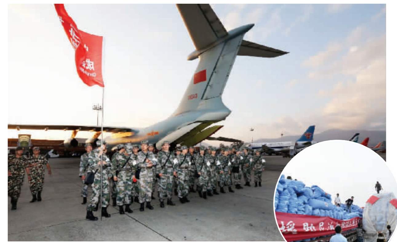
中国空军首架救援飞机飞抵尼泊尔地震灾区 新华社发 ▶援助尼泊尔救援物资即将从南京禄口机场启运 新华社发