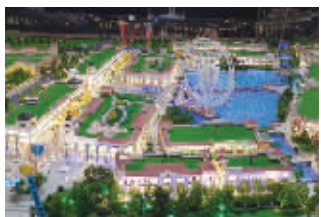
汤山百联奥特莱斯公园效果图