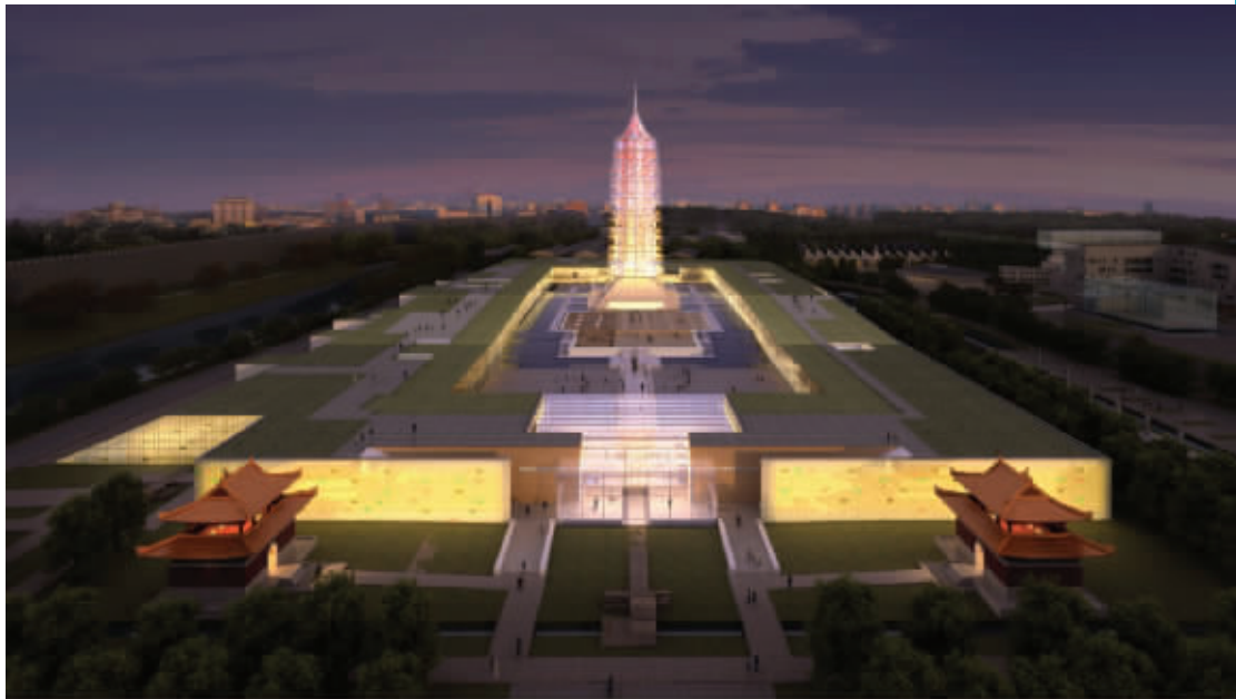
大报恩寺遗址公园全景效果图