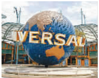
新加坡环球影城,未来南京也会有“梦工厂”品牌乐园