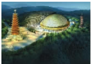
牛首山遗址公园夜景效果图