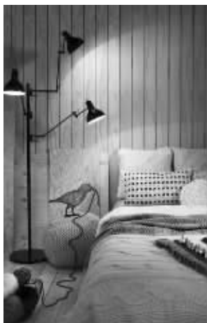
本版均为资料图片

间的格调,最好选择光线柔和、朦胧的串灯、灯箱或灯带。串灯是制造浪漫气氛的高手,如果位置再特别一点,床头或者床底,晚上灯一开,心都融化了。