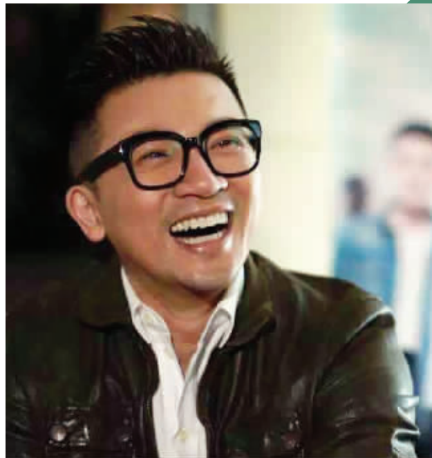
苏有朋来南京聊《左耳》拍摄花絮

昨天下午,苏有朋携马思纯、段博文来南京为导演处女作《左耳》做宣传。据悉,《左耳》在首映当天就取得了4000万票房的高成绩。就在昨天下午,苏有朋不仅接受了记者的采访,还亮相卢米埃影城紫峰店,与南京观众亲密交流,为影迷进行现场签售。