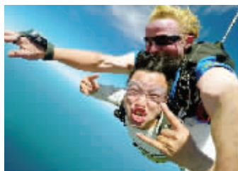
节目中的跳伞镜头

而针对如此争议,节目组表示,一切都是按照澳大利亚高空跳伞方的流程。至于为什么会选择高空跳伞这项极限运动挑战,制作方回应:“因为《前往世界的尽头》是一个励志的真人秀节目,我们当中的一些嘉宾其实是恐高的。我们希望他们完成任务,告诉所有观众,困难是可