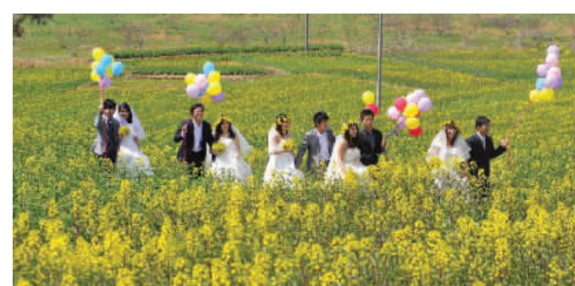
看油菜花,也是最近几年兴起的旅游热潮