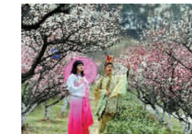
年轻人比中老年人更懂“休息”的意义