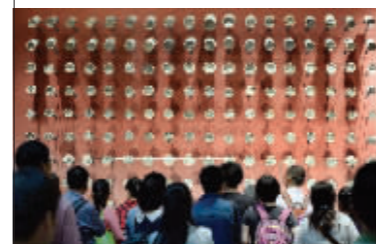
因为扎堆,连展览也是人满为患