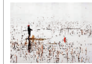
独自休息的人越来越多