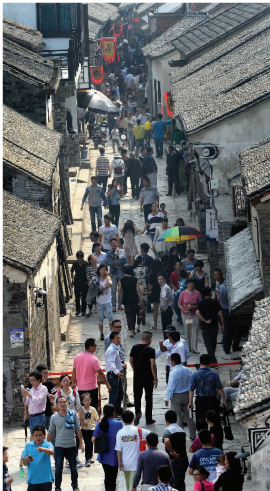
节假日的增多,催生了持续数年的“古镇热”