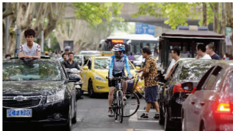
节假日的道路也是拥堵的