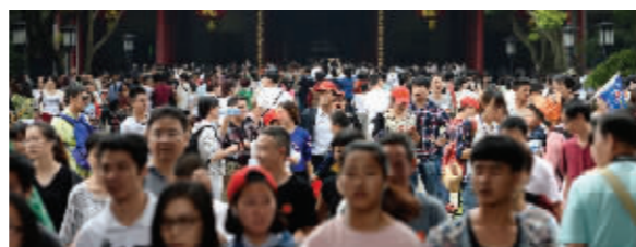
节假日的景区人满为患