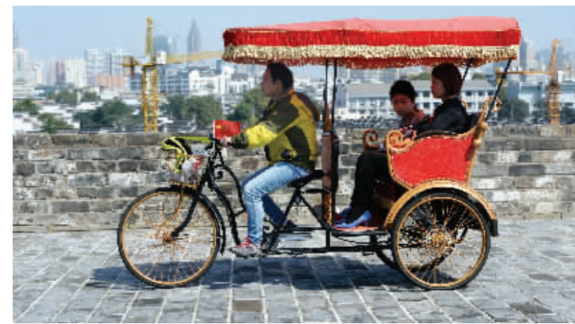
家门口的城墙,成了南京居民的休闲去处