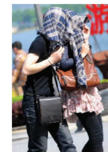
顶着烈日也要出游,因为假期是固定的