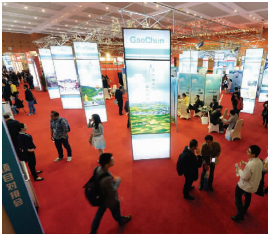
“留交会”为各类人才提供一个创新创业的舞台