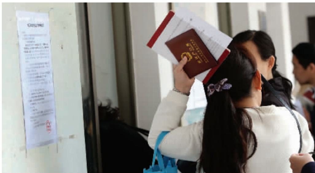
南京跨区就读小学生回区登记第一天,不少家长带着各种证件排队报名

陵汇文学校的学区,孩子想在这所学校上学。这位家长倒也没有隐瞒,表示自己在外区有100%的产权房,但他认为,自己也有鼓楼区房子的产权,应该能入学。