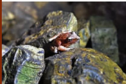
洞里发现一只沼水蛙

大约1个小时后,仙洞的每一个有可能通向别处的小洞和细缝,都被救援队员们仔细看了又看,发现仙洞并无别的通路,所以通向长江的故事,也仅仅是传说而已。