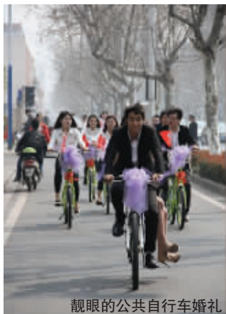
靓眼的公共自行车婚礼

而在经济价值方面,按全省日均使用量70万次1小时免费,每次出行节省1元计算(以乘公交计算),我省公共自行车系统每天为广大市民节约出行费用至少70余万元,全年为广大市民节省出行费用约2.5亿元。