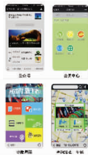
更便捷的手机客户端服务

此外,现在很多城市都鼓励采用公共自行车绿色出行,全省乃至全国平台的建立,还可以通过这些大数据制定鼓励和加分政策,让切实绿色出行的市民获得奖励,进而让公共自行车越走越远,让绿色交通真正融入我们生活。