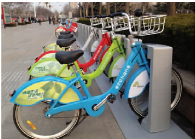
公共自行车已成街头风景