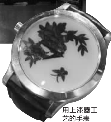
用上漆器工艺的手表