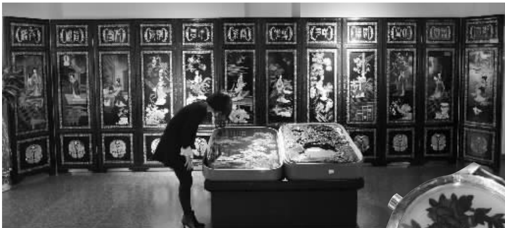
十二钗漆面屏风

一件十二钗漆面屏风,设计者却不按套路出牌,“任性”地淘汰部分人物,挑选出自己心中的十二钗,并放到了屏风上,不过,这个“任性”的艺术品却价值800万元。昨天,中国漆器精品展在江苏工艺美术馆拉开帷幕,展览汇集了来自江苏扬州、山西平遥等五大主产地的百余件漆器,将持续到5月3日。本周末,4位漆器大师还会亲临展览,现场演示漆器的制作过程。