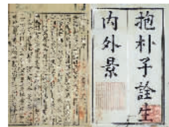
本组图片为资料图片