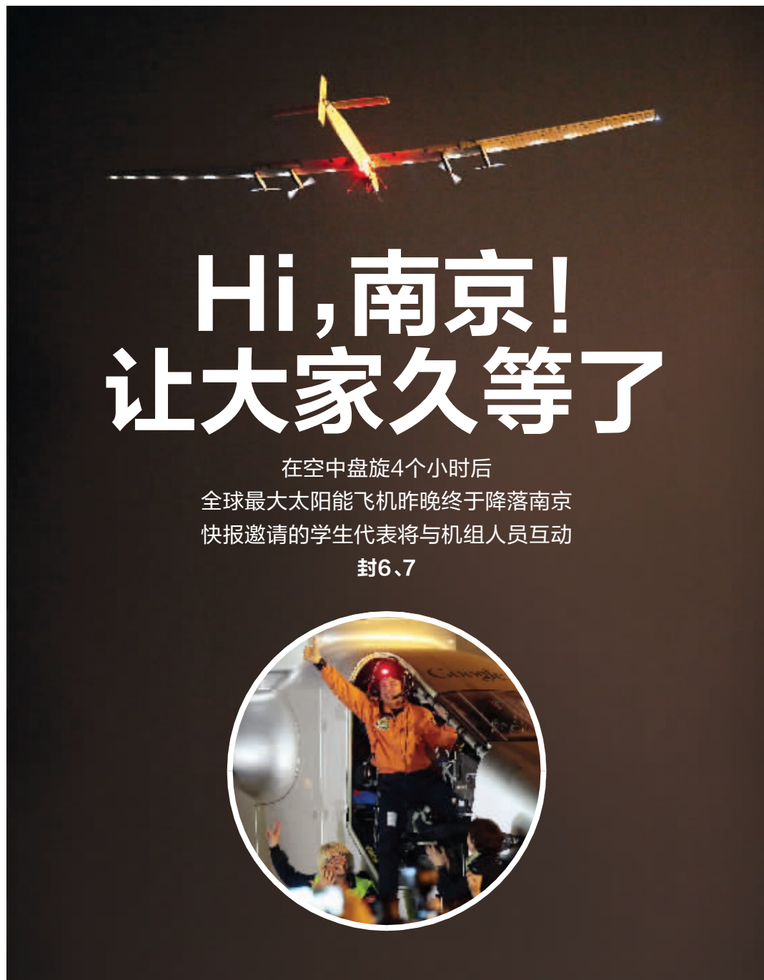
“阳光动力2号”昨晚降落南京，飞行员皮卡尔出舱后与大家打招呼