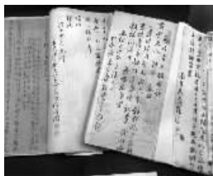
《冬青馆吟草》手稿