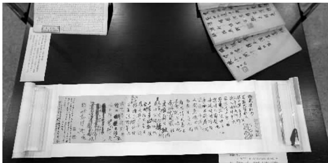
南大图书馆镇馆之宝之一:《豁蒙楼联句》