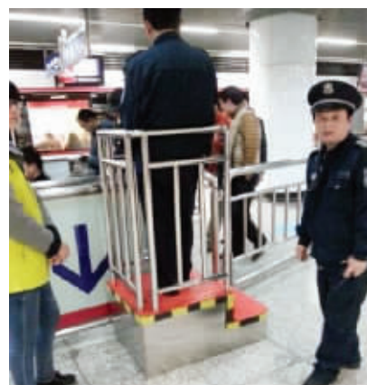
南京地铁站的安全瞭望台 资料图片

地铁成为了众多市民首选的出行方式,南京也不例外。随着南京地铁网络越织越密,地铁客流量也不断增加,目前南京地铁日均客流量保持在200万以上。为了确保乘客乘车安全,避免安全隐患,南京地铁相关部门也采取了诸多措施。除了车站工作人员实时引导外,今年南京地铁还新设了“安全瞭望台”来帮助疏导客流。