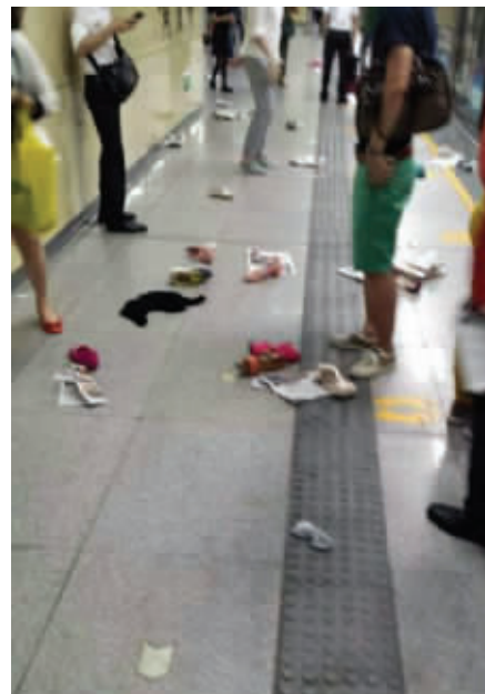
事故现场一片混乱