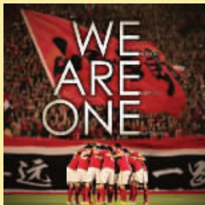
恒大发布亚冠海报

和恒大相比,国安最近遇到了不少麻烦,现在球队有多达7名球员受伤,上周末的中超联赛更是惊险地战