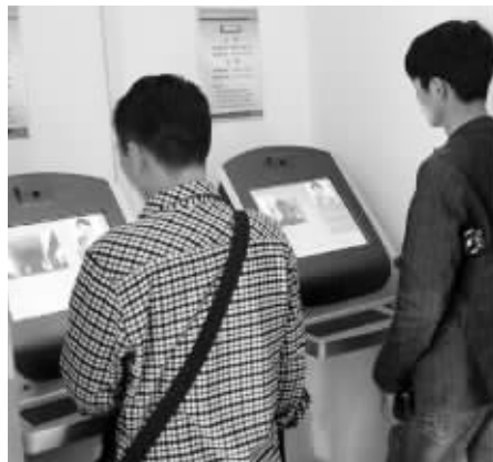
学员“刷脸”签到

快报讯(通讯员 宁交轩 张玫玲 记者 王瑞)昨天,现代快报记者从南京车管所获悉,从今年4月份开始,南京车管所12分学习班首次启用学员人脸识别系统,目前该系统正处于试运行阶段。今后,驾驶人“回炉”学习都必须通过“刷脸”签到、签退以及参加考试,这不但缩短了原先指纹录入所需的时间,而且基本可以杜绝代考代学的情形出现。