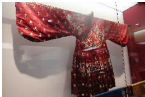
明·织金寿字龙云肩通袖龙襕妆花缎衬褶袍(复制品)