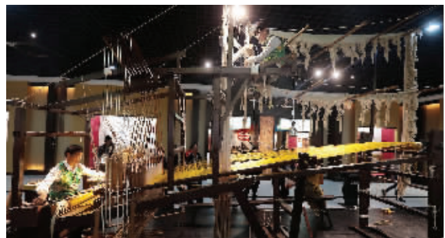
现场展演云锦织造过程

示以及历代丝绸文物复制精品和云锦妆花各类花色品种的展示。其时间跨度从战国到明清直至现代。其中云锦专业实物资料千余件,相当一部分是重要的历史文物,云锦图稿等资料2000余份,包括了过去官办织造局留下的“汉府稿”,以及各类专业图书资料58000余册。除了看实物、看操作,还可以利用现代科技,进行互动,可以打开电子书,看看和《红楼梦》相关的故事。