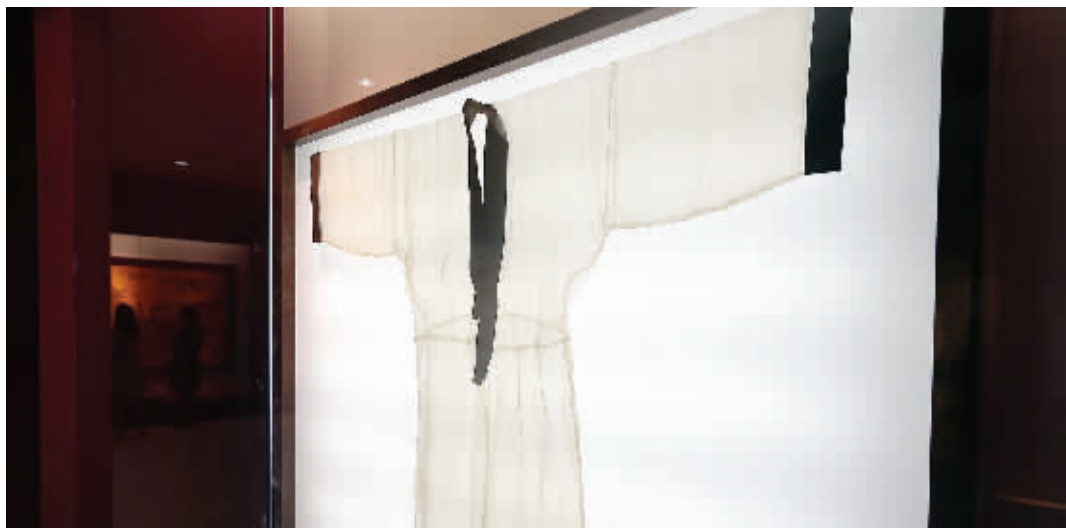
西汉·素纱襌衣(复制品)

虽然纱衣样式简约,但复制并不容易。王宝林说,从上世纪80年代起,南京云锦研究所和镇江桑蚕研究所合作,足足用了13年才完成复制,“主要是原材料很难找,现代的蚕宝宝个头太大,必须使用蚕退化后产生的病蚕丝,才能达到轻薄透的效果。”“眼前这件重量仅有49.5克,只比原件略重了0.5克”。王宝林说,由于这件素纱襌衣比较娇嫩,需要冷光源、防虫防蛀防潮,一直压在箱底,从未拿出来展出过,“这是第一次和公众见面。”这件素纱襌衣究竟有多薄?还有一种说法很形象,就是叠起十层来,透过仍可看清报纸。