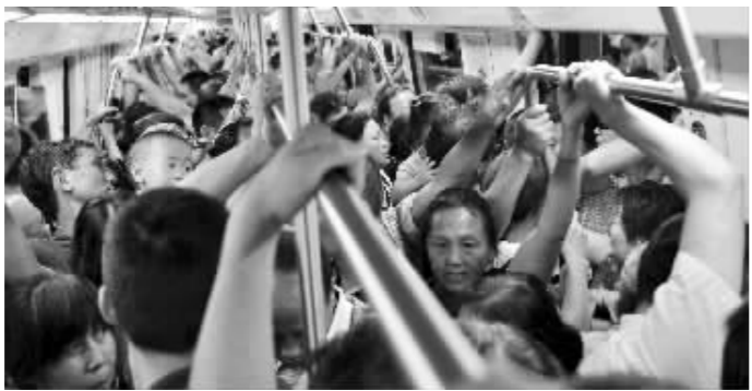
宁天城际(南京-天长)一期开通,列车上挤满了乘客