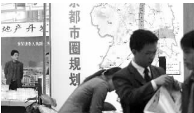
“一小时都市圈”的概念,带动了房地产业的发展