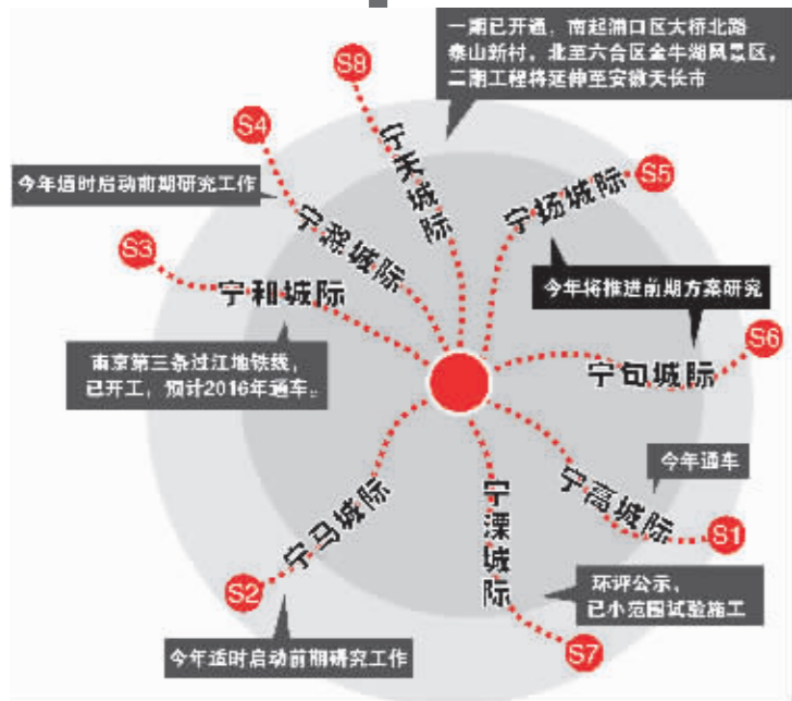
8条城际轨道联通南京都市圈 制图 雷小露

因此,2000年以前,他刚一提出南京一小时都市圈概念,就立即得到圈内城市的强烈认同,“大家都有点,我们本来就是兄弟一家人”的感