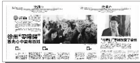
现代快报相关报道

快报讯(记者 刘清香)在徐州,GDP重要,青山绿水重要,老百姓的尊严、幸福感同样重要。三年多时间里,徐州通过百姓办事“零障碍”工程,极大程度改善了以往“门难进,脸难看,事难办”的状况。现代快报推出的“百姓办事零障碍——徐州报告”深度调查报道,详细梳理了徐州经验,在全国范围内引起热议。