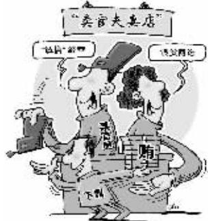
漫画:“合营” 徐骏 作

5年受贿116次,总额858万余元,其中收受41名下属买官贿赂739万余元,占其受贿总数的86%。15日,中共菏泽市委原常委、统战部原部长刘贞坚受贿案由潍坊市中级人民法院一审公开宣判。法院经审理查明,刘贞坚犯受贿罪,判处有期徒刑,剥夺政治权利终身,并处没收个人全部财产;扣押在案赃款人民币333万元依法予以没收,上缴国库,其余赃款525.1579万元继续追缴。