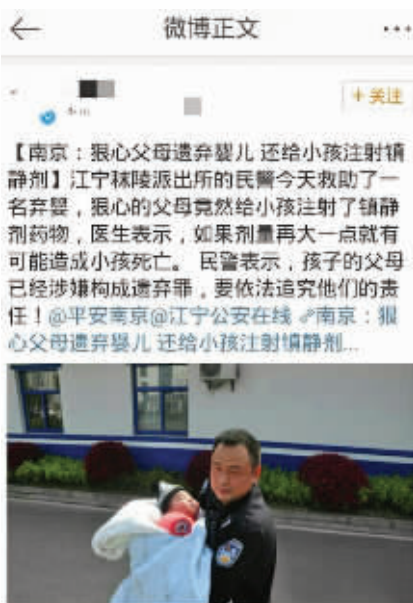
不实微博