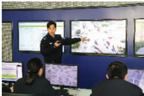
图为教员给相关人员培训。

据了解,为了运用科技设备,该大队组建了24人的监控值守队伍,定人、定机、定岗、定责巡查,确保24小时不脱人、不脱岗、不脱节,实时采集相关信息,用好用活,为视频侦查和图侦研判提供有效资源。2月上旬,该市城区接连发生多起乘隙盗窃顾客财物的案件,大队迅速组织图侦研判人员对发案部位监控图像综合研判,派出便衣侦查力量在商品街侦查时,发现两男三女互打手势,时分时合作案时全部抓获。经查,5名嫌疑人交待了在商品