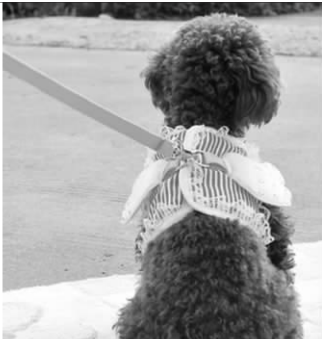
本版均为资料图片

网络上关于这样的质疑不少。生活中也不乏因看管不利,被狗咬伤的惨剧。4月13日,海门发生一起恶犬袭婴的悲剧,孩子的半边脸被严重毁容。每年春夏,都是狗咬伤事件的高发期。有关人士提醒,除了自己做好防护工作,加强对婴幼儿的监护力度,狗主人也应该在遛狗时用牵引绳将其拴住,防止伤人。文明养狗,做个优雅的遛狗人,从选择一根牵引绳开始。 现代快报记者 乐媛